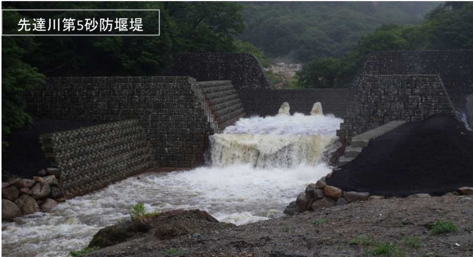
閉塞後の出水 黒湯連続雨量 21mm