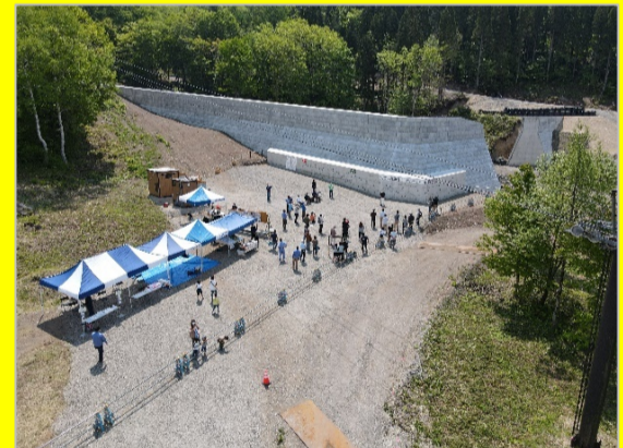
水沢第2砂防堰堤ボルダリングウォール オープニングセレモニーの様子