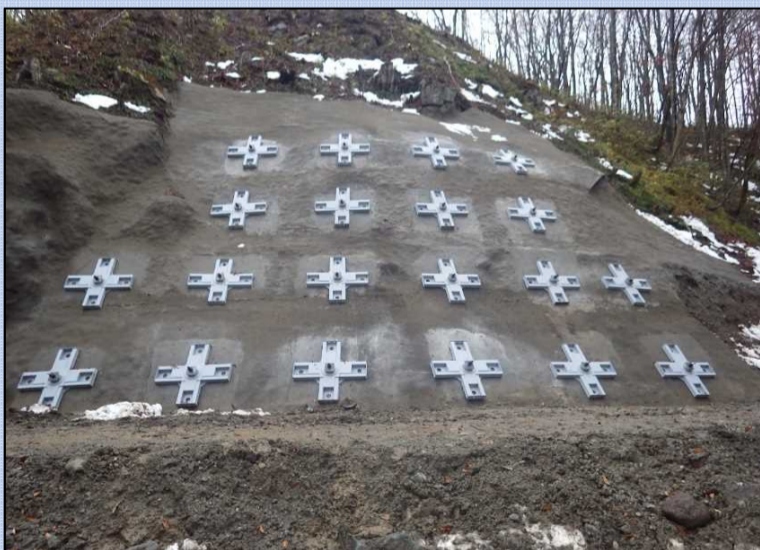
グラウンドアンカーを4段施工しました。