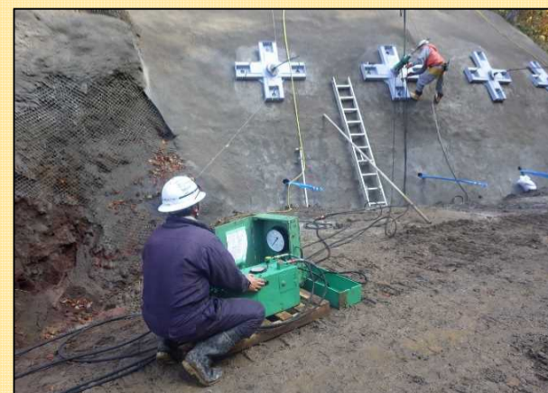
アンカーを緊張している状況です。 アンカーの縮む力を利用して地山を押さえつけます。