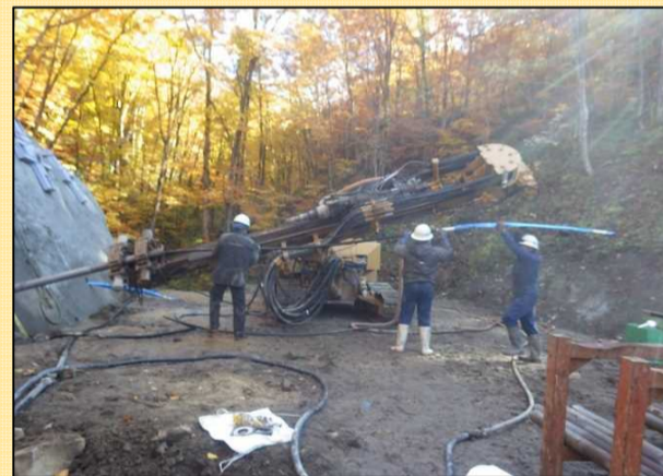
アンカーを挿入している状況です。 アンカーは長いもので11mあります。