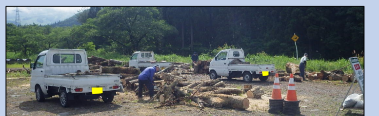
前回の無償提供時の様子です。