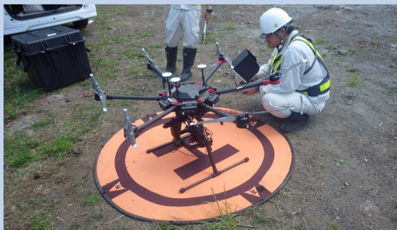
ドローンを使って測量をしました。