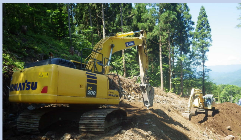
運搬路を作っている様子です。