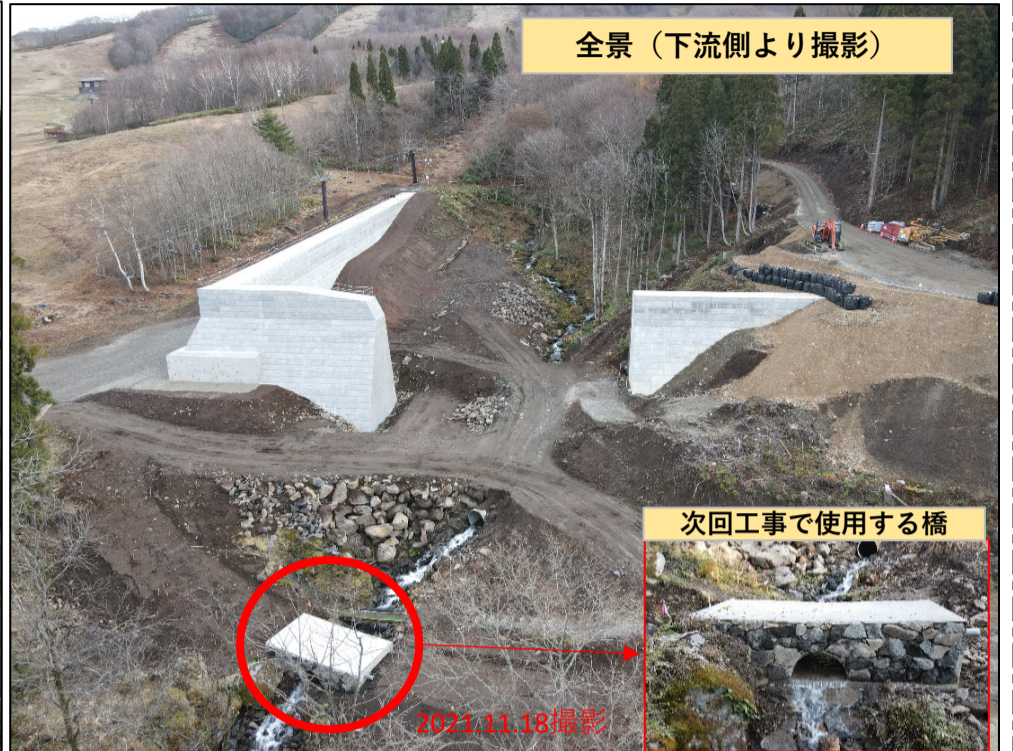
全景（下流側より撮影）