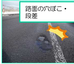
路面の穴ぼこ・段差