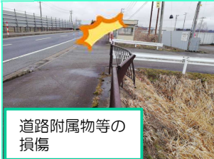
道路附属物等の損傷