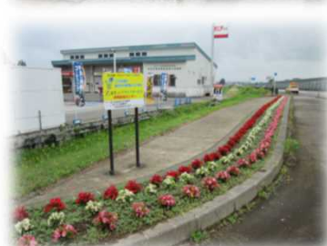
(株おはこライフサービス様)