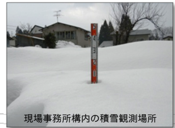
現場事務所構内の積雪観測場所