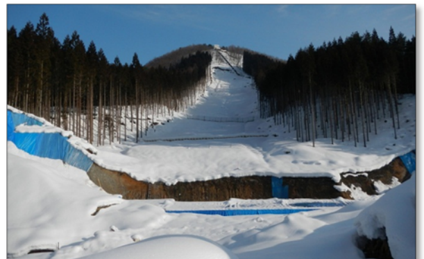
現地全景(2月27日撮影)

崩壊斜面の不安定な土砂移動がないか、毎日9時に測定監視しており、現在まで異常は確認されていません