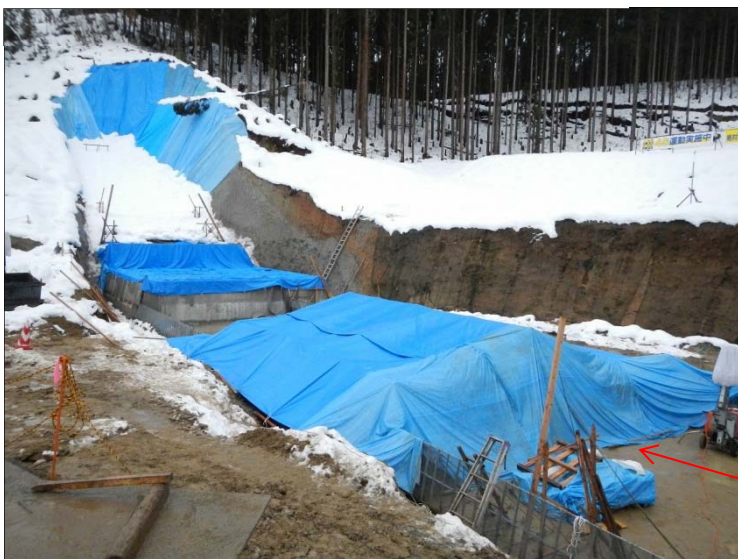
コンクリート養生状況（12月20日撮影）