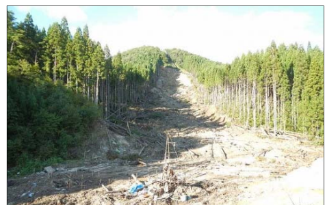
工事着手前（9月27日撮影）