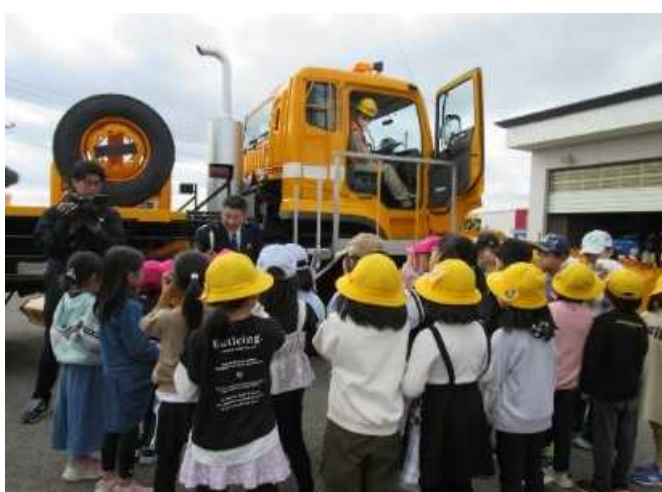
▲エンジン始動時の周りの声の確認