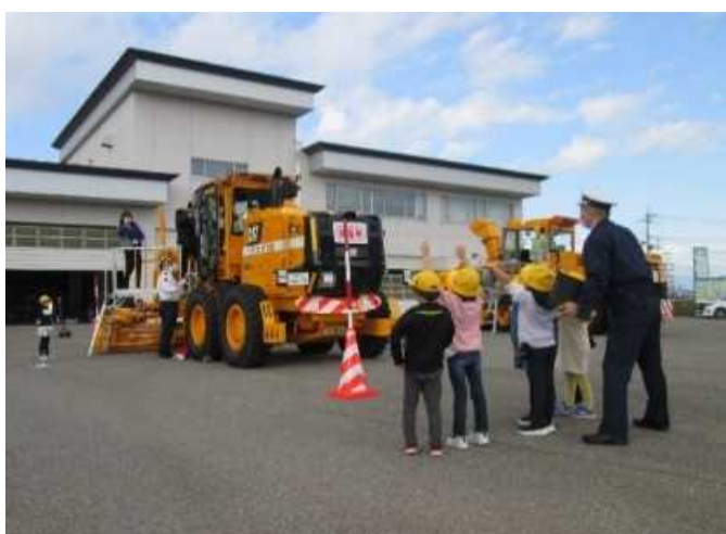
▲乗車による運転席からの「死角」の確認