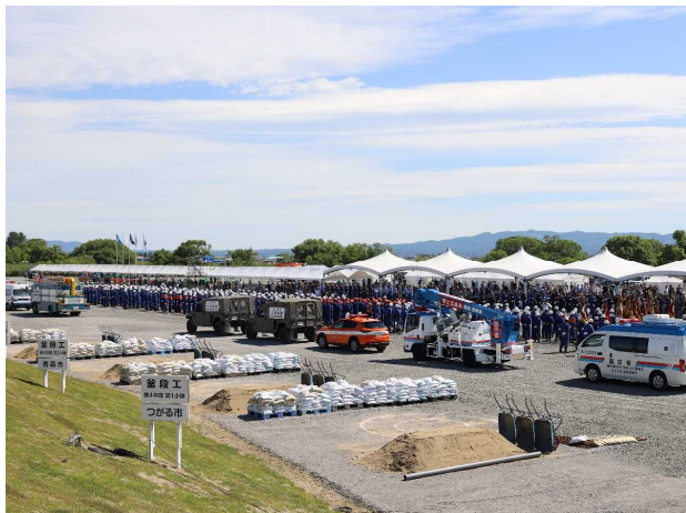
令和6年度岩木川総合水防演習開会式