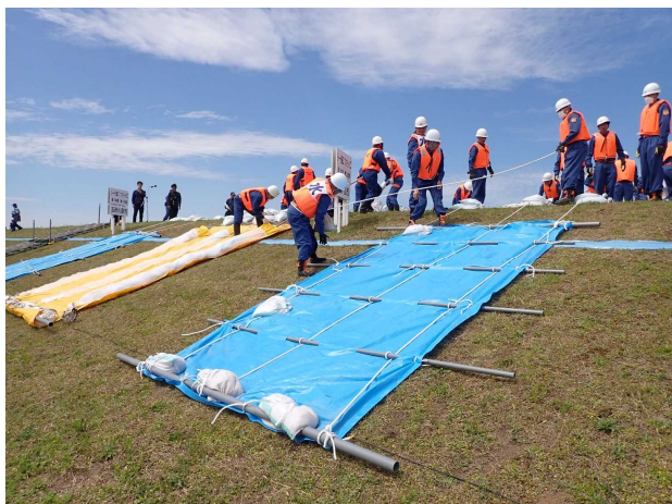
水防工法訓練状況