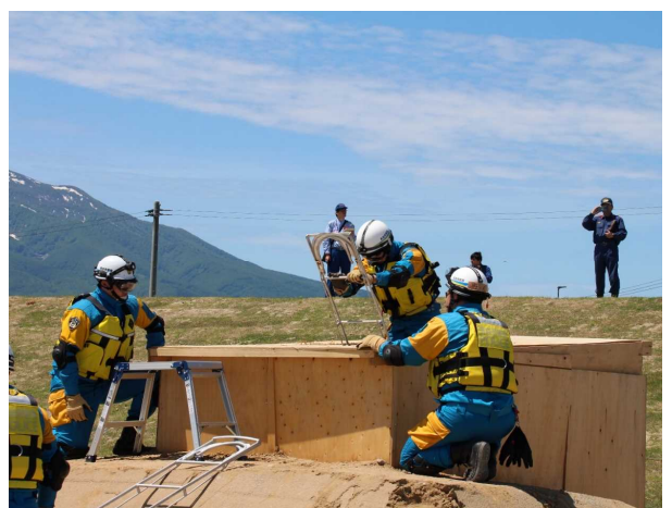
青森県警察本部による救助・救出訓練