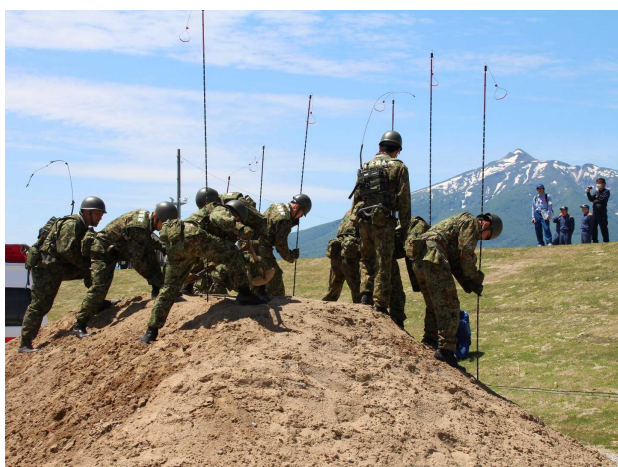
陸上自衛隊による救助・救出訓練