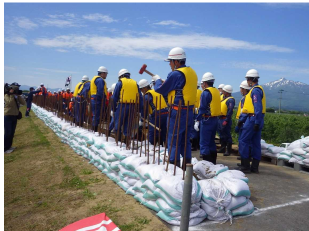
水防工法訓練状況