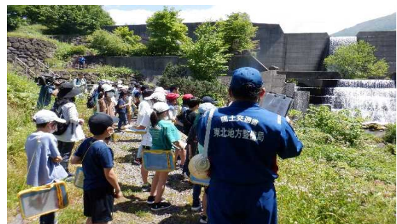
小先達川第1砂防堰堤