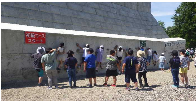
水沢第2砂防堰堤ボルダリングウォール