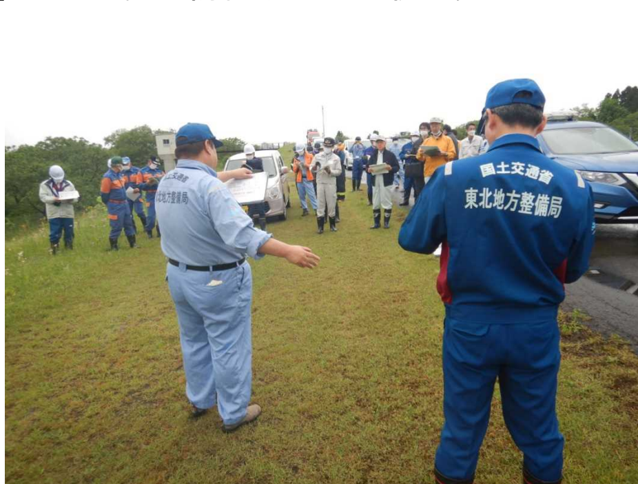
【大曲仙北地区 (R5.5.19 (金))】 大仙市関係機関との合同巡視の様子