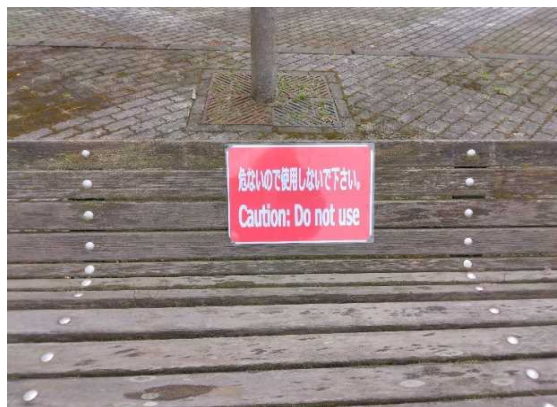
当面の間使用禁止とし表示を行いました。