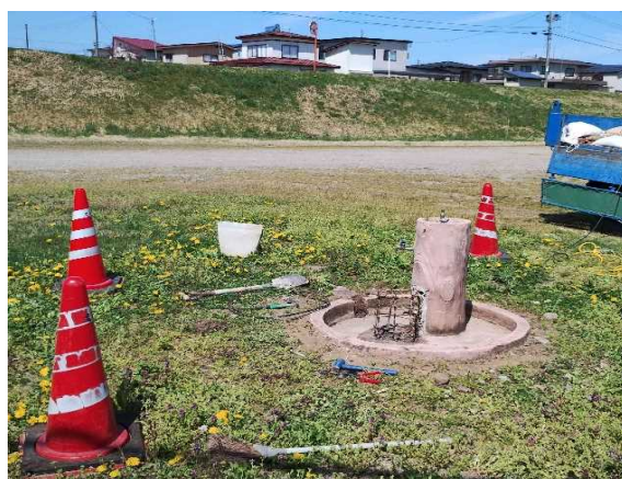
手洗い設備の損傷