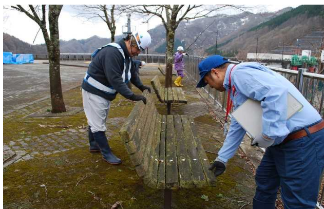
ぐらつきがありました。(3基)。