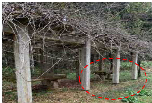
木製ベンチの破損