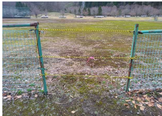
損傷部分を撤去しトラロープで応急処置を行いました。