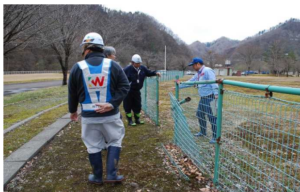
野球場フェンスに損傷がありました。