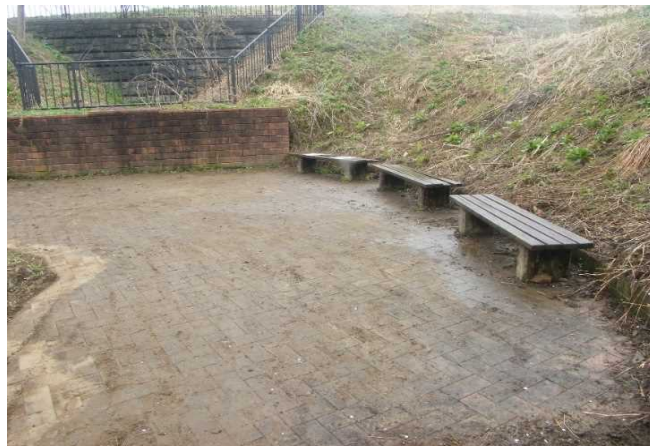
枝葉等のごみ堆積