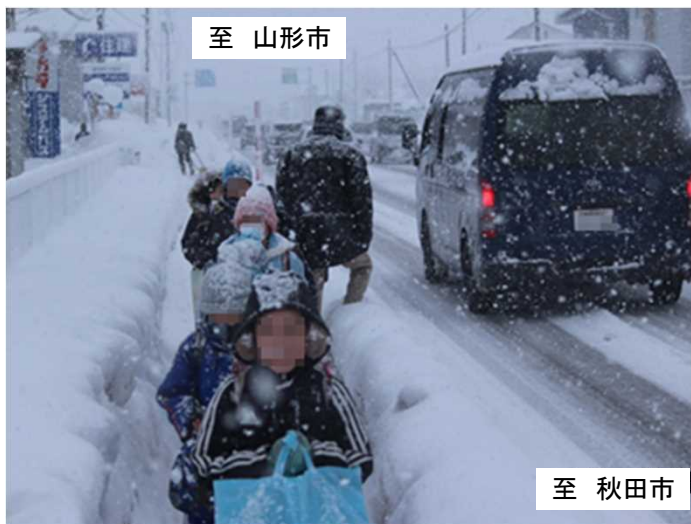
積雪時の歩道狭隘状況