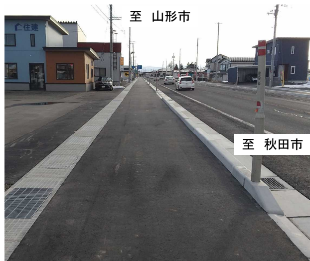
歩道拡幅後、完成状況