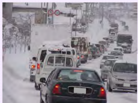
▲冬期間、悪化する渋滞