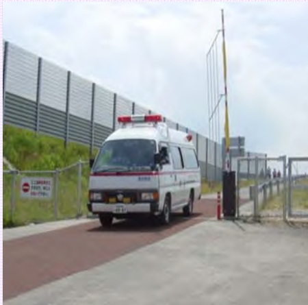
▲湯沢横手道路の救急車退出路を利用する救急車