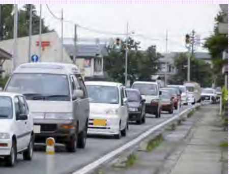
▲国道13号の渋滞状況