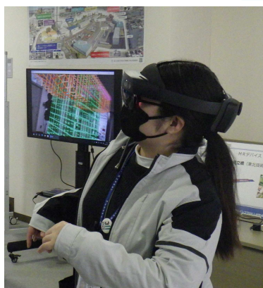
< 実習：MR体験 >