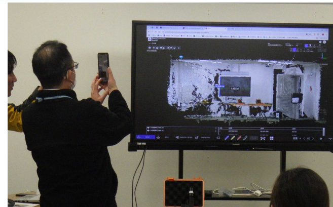
< 実習：高速点群生成 >