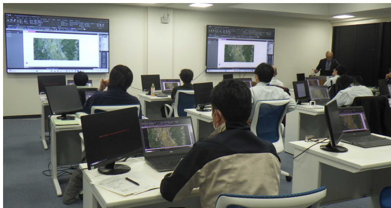
< 実習：3次元CAD 点群体験実践演習 >