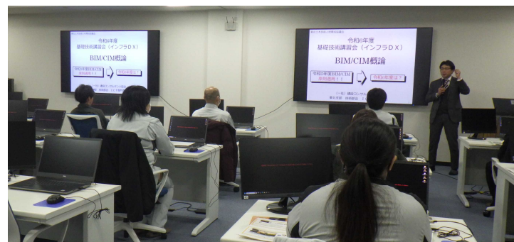
< 座学：BIM/CIM概論 >

東北土木技術人材育成協議会では、 官民合同 で 若手技術者の育成 を目的とし、基礎技術講習会を開催しています。