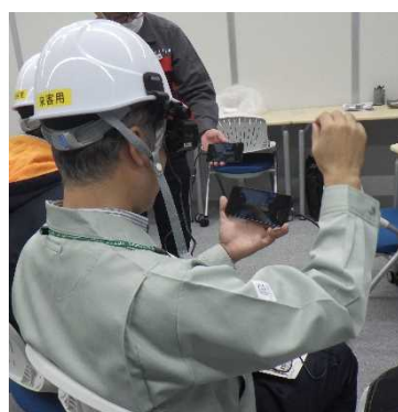
< 実習：遠隔臨場 >