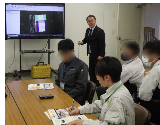
< 実習：遠隔臨場 >