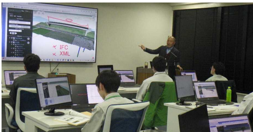
< 実習：3次元CAD 点群体験実践演習 >