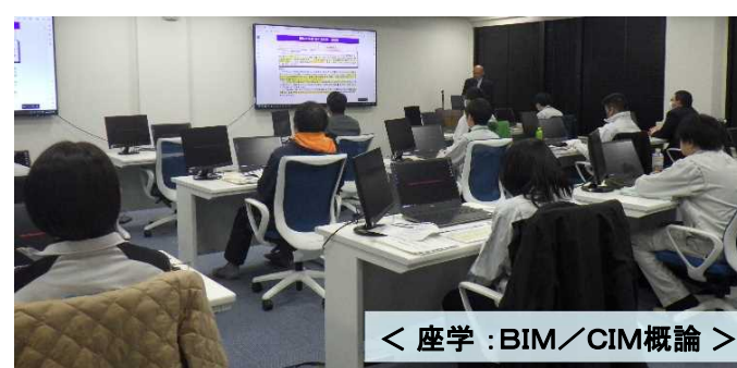
< 座学：BIM/CIM概論 >

DX 東北インフラDX人材育成センターにて開催 担当：総括技術情報管理官（内線301）