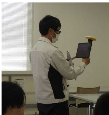
< 実習：AR体験 >