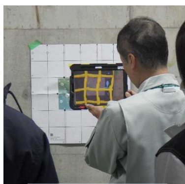
< 実習：鉄筋探査 >