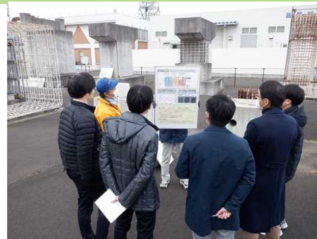
表層品質と耐久性について