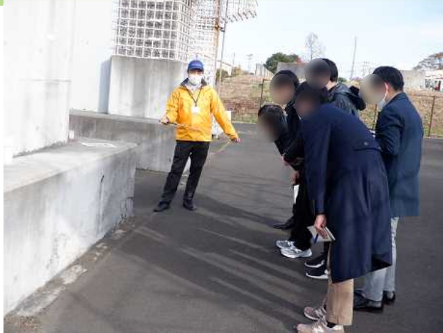
不適切施工について

令和6年11月20日に横浜市交通局5名の方が利用されました。利用者の方々からは「コンクリート構造物は、丁寧に施工すること。この意識が強まった。大変良かったです。」「シュミットハンマーや鉄筋探査機の計測実習もでき、分かりやすかった。」「実物をもとに説明を受けると、理解が進みました。」などの意見をいただきました。