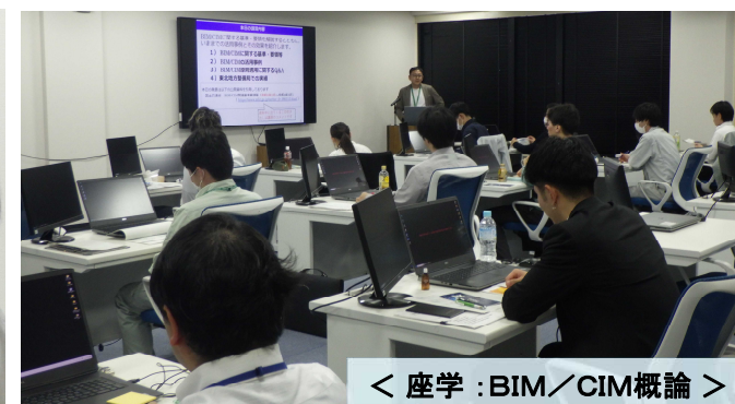
< 座学：BIM/CIM概論 >

DX 東北インフラDX人材育成センターにて開催 担当：総括技術情報管理官（内線301）