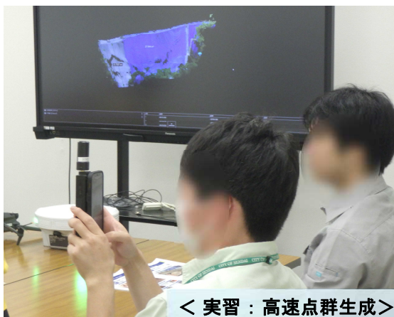
< 実習：高速点群生成 >