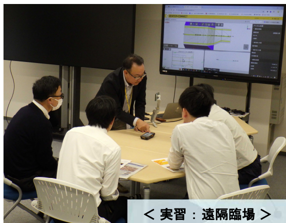
< 実習：遠隔臨場 >