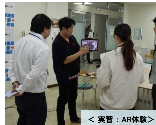
< 実習：AR体験 >