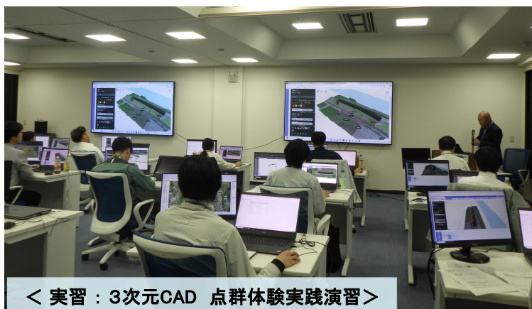
< 実習：3次元CAD 点群体験実践演習 >