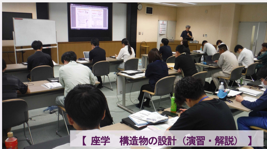
【座学 構造物の設計（演習・解説）】