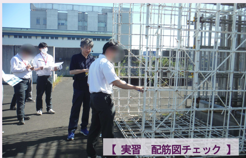
【実習 配筋図チェック】