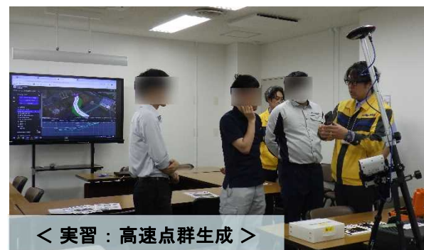
< 実習：高速点群生成 >