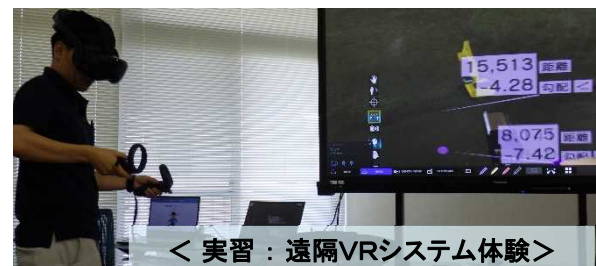
< 実習：遠隔VRシステム体験 >