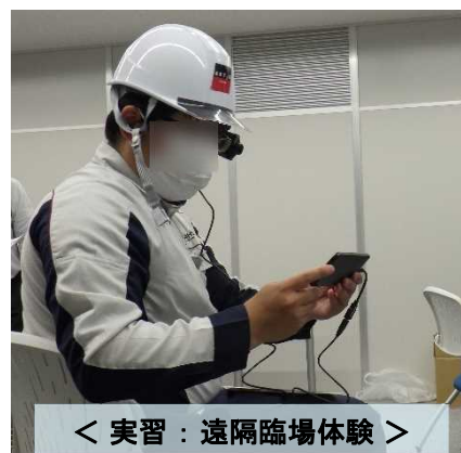
< 実習：遠隔臨場体験 >