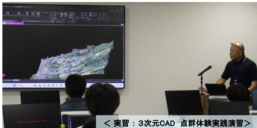
< 実習：3次元CAD 点群体験実践演習 >

東北土木技術人材育成協議会では、 官民合同 で 若手技術者の育成 を目的とし、基礎技術講習会を開催しています。