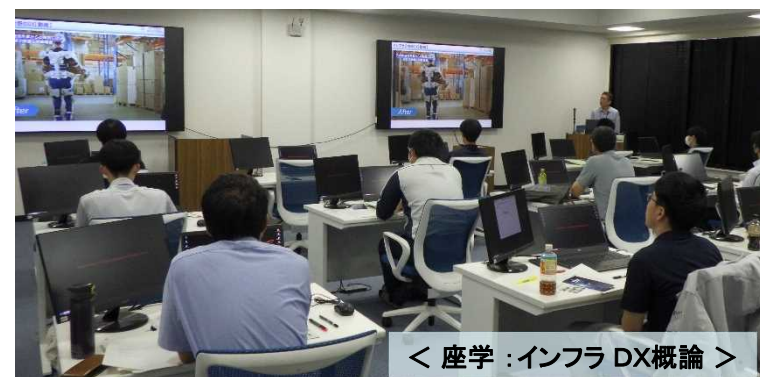
< 座学：インフラDX概論 >