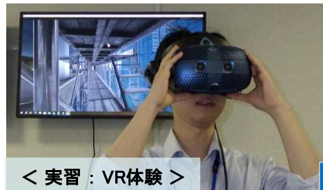
< 実習：VR体験 >