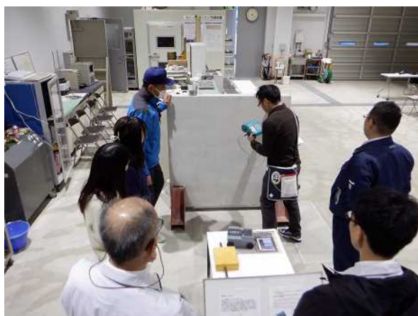
非破壊検査(鉄筋探査)体験