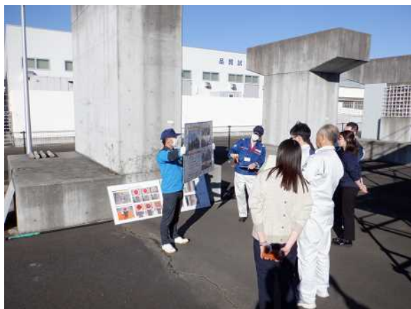
不適切施工について

令和5年11月22日に青森県県土整備部6名の方が利用されました。 利用者の方々からは「本物の施工不良等実物を見ることが出来、有意義だった。」などの意見をいただきました。