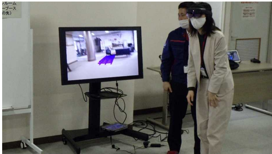
【XRブース】 MR（複合現実）による3次元モデルの再現を確認