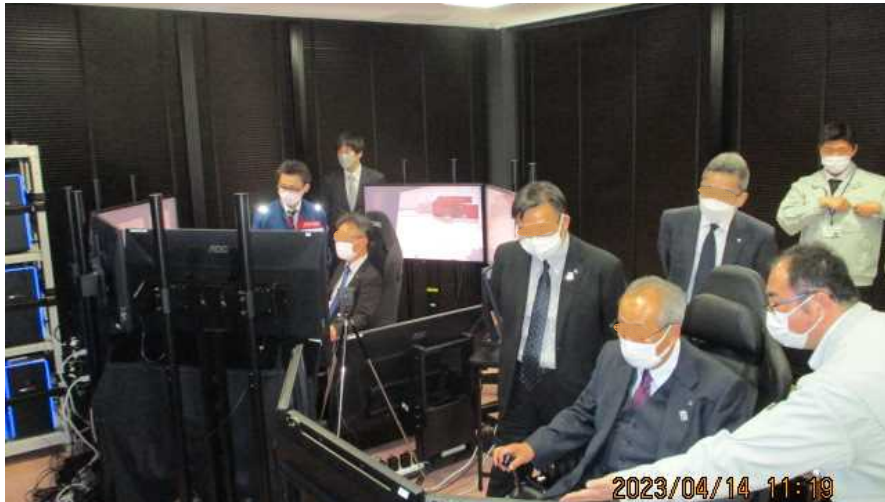
【シミュレーターブース】 除雪グレーダ及びバックホウのシミュレータによる操作訓練体験