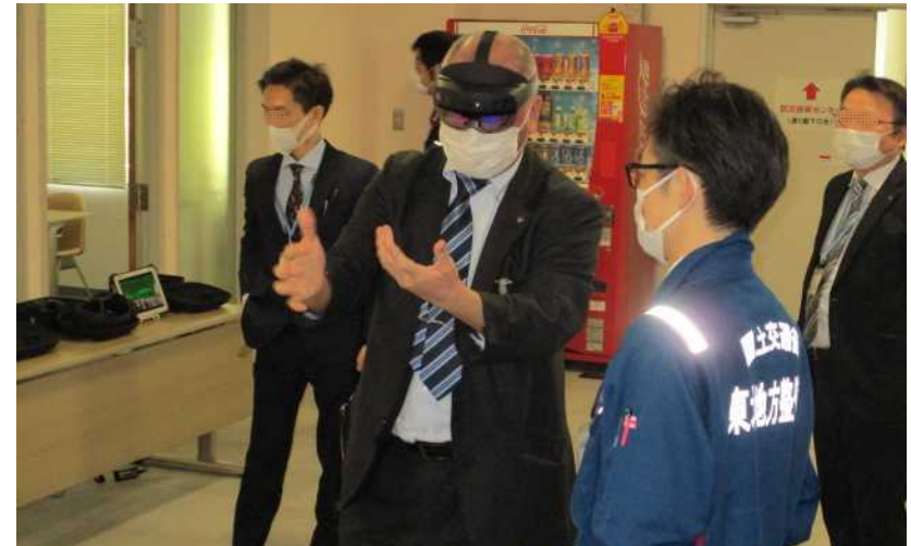
【XRブース】 MR（複合現実）による3次元モデルの再現を確認