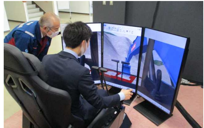
【シミュレーターブース】 バックホウのシミュレータによる操作訓練体験