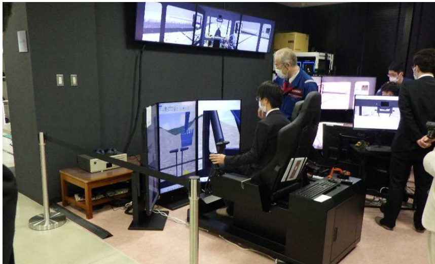
【シミュレーターブース】 バックホウのシミュレータによる操作訓練体験