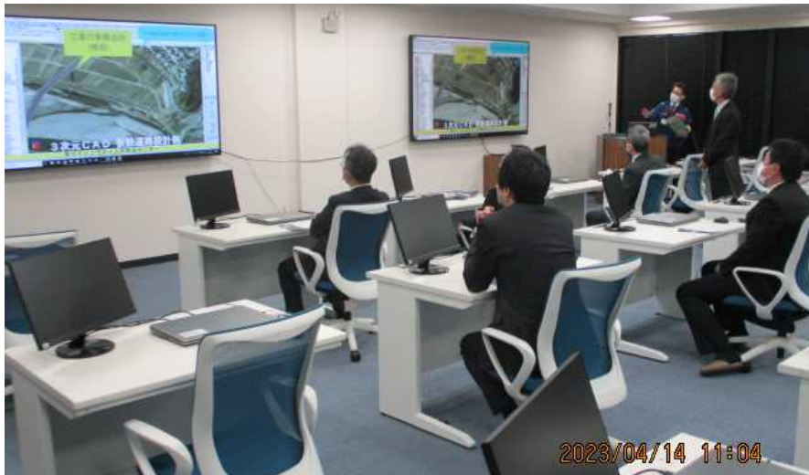
【人材育成ルーム】 3次元データを活用した仮設道路設計の紹介動画の視聴