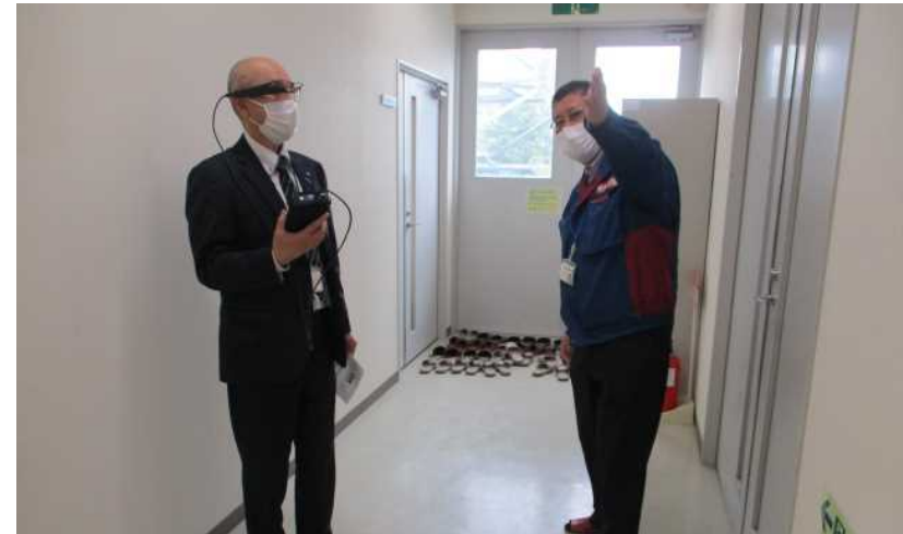
【DX・プレゼンルーム】 遠隔臨場の疑似体験