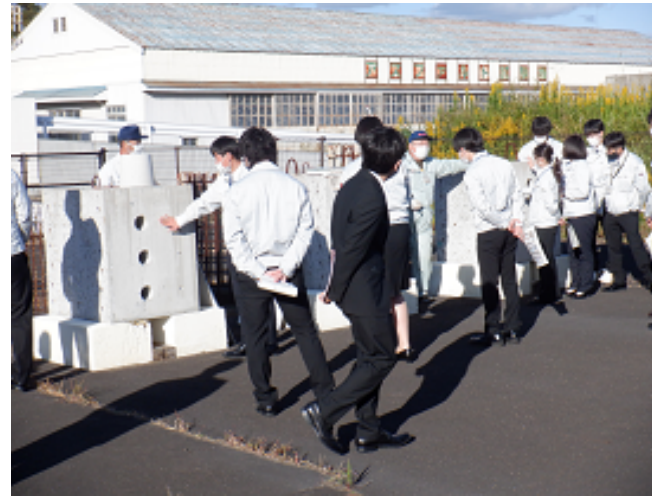
表層品質と耐久性について