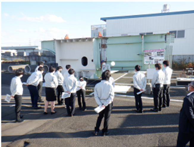
被災した鋼箱桁について