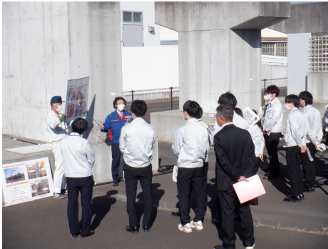
抜き取りコアの水の浸透比較について