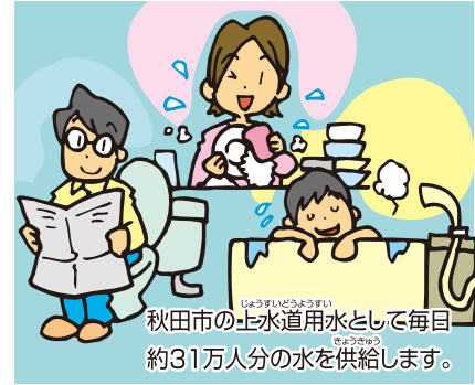
秋田市の上水道用水として毎日約31万人分の水を供給します。