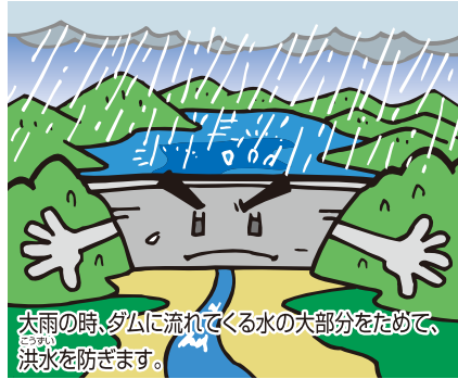
大雨の時、ダムに流れてくる水の大部分をためて、洪水を防ぎます。