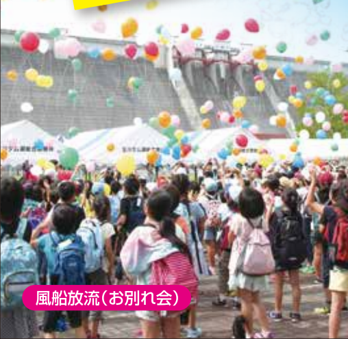
風船放流(お別れ会)