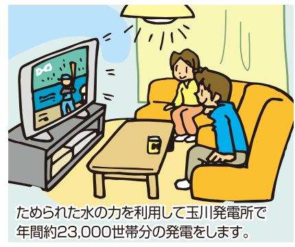
ためられた水の利用して玉川発電所で年間約23,000世帯分の発電をします。