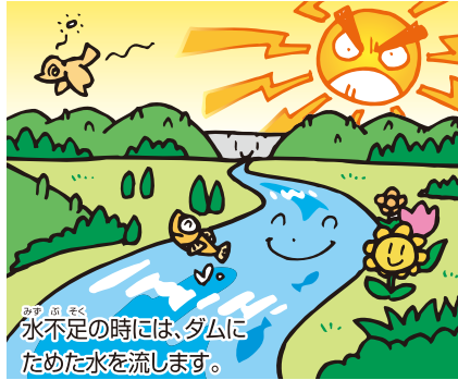
水不足の時には、ダムにためた水を流します。