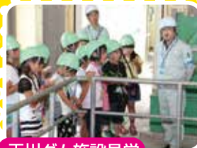
玉川ダム施設見学