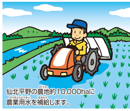
仙北平野の農地約10,000haに農業用水を補給します。