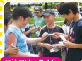
交流フリータイム