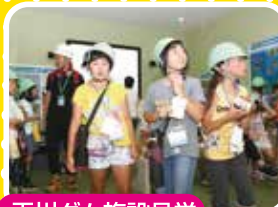
玉川ダム施設見学