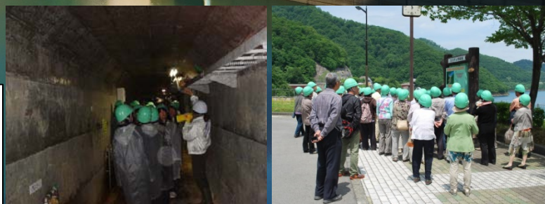
玉川酸性水中和処理施設全景

また、予約者は当日ダム資料室内で受付・資料配付を行います。忘れずにご来所下さい。