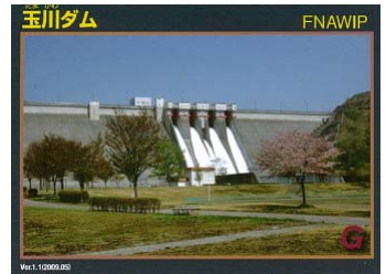
玉川ダム ダムカード