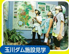
玉川ダム施設見学