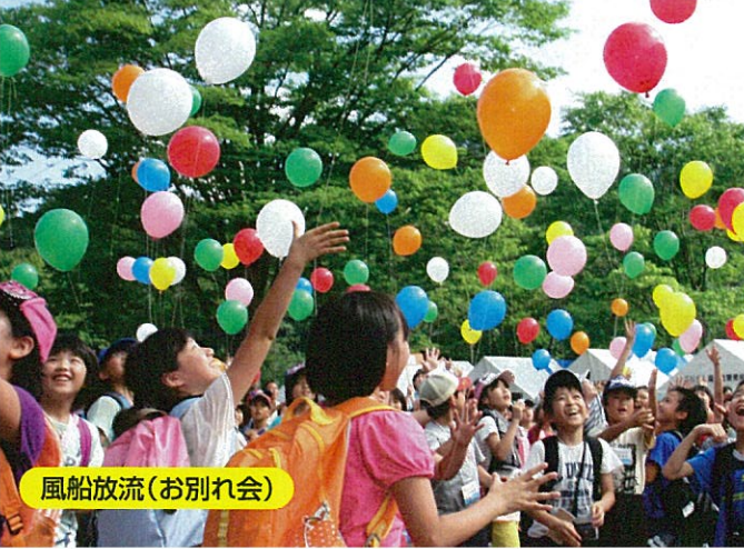
風船放流(お別れ会)