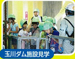
玉川ダム施設見学