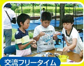
交流フリータイム