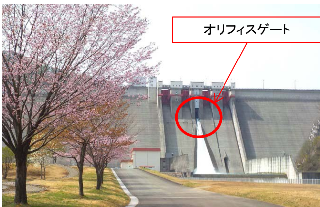
玉川ダム下流公園の山桜とオリフィスゲートからの放流状況(H27.4下旬撮影)