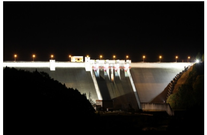
国道341号駐車帯から撮影