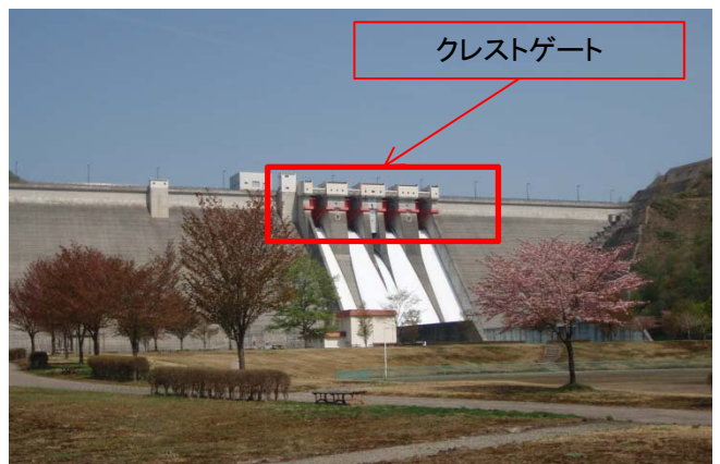
玉川ダム下流公園の山桜とクレストゲートからの試験放流状況(H21.5.9撮影)