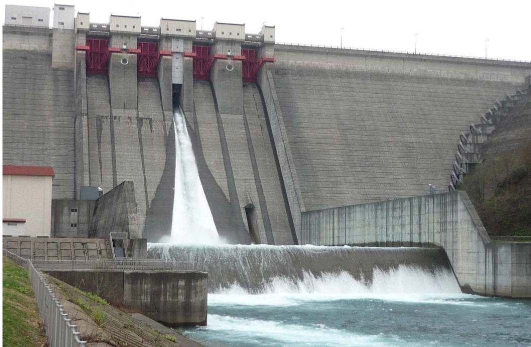
△玉川ダム放流状況