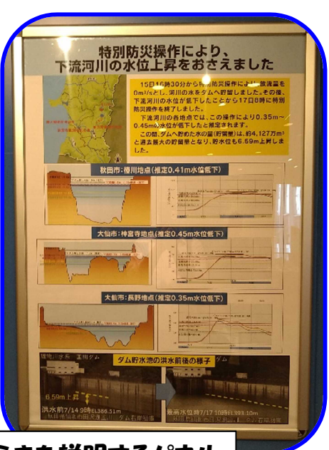
洪水時のダムのはたらきを説明するパネル