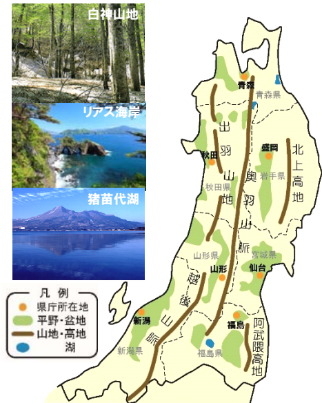
図1 東北ブロックの区域

13 また、ブロックの面積の約7割が森林であるなど、自 14 然資源に恵まれており、多様な生態系とともに豊富な 15 水資源を有している一方、ブロックの面積の約8割が 16 豪雪地帯であり、冬期には積雪等の影響が大きい。