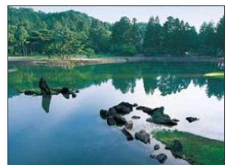
図8 世界文化遺産の毛越寺 (岩手県平泉町)

33 東北ブロックが持つ豊かな自然、美しい景観、歴史や文 34 化、震災の教訓を後世に伝える震災遺構などの魅力の創出・活用・保全に努め、後世に継 35 承していくための更なる取組が必要である。