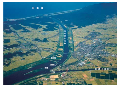
図3 抜本的な改修事業が進む信濃川下流部の大河津分水