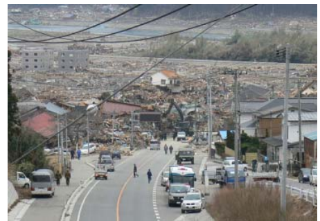
図5 東日本大震災による被災状況 (岩手県陸前高田市)

13 平成23年3月11日に発生し、我が国観測史上最大の 14 マグニチュード9.0を記録した東北地方太平洋沖地震、 15 津波・地盤沈下・液状化・土砂災害に加え、東京電力福 16 島第一原子力発電所事故も伴う未曾有の複合災害とな 17 り、地域に大きな被害をもたらした。被災地の復興には、 18 被災者の生活再建を最優先としつつ、地域の復興を迅 19 速に進めるとともに、将来を見据えた持続可能なまちづ 20 くりに取り組む必要がある。