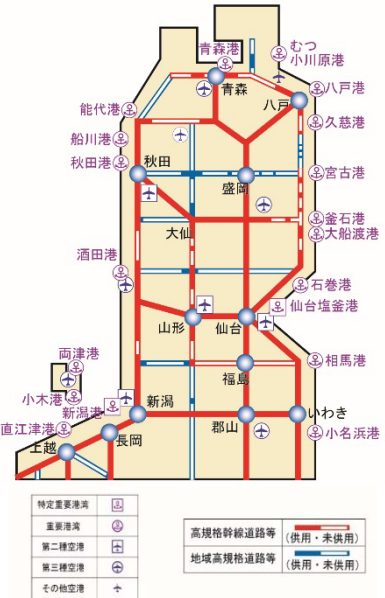
図4 東北ブロックの広域交通ネットワーク

7 東北ブロック内外のアクセスの利便性が向上し、地域 8 間の連携が強化されることにより、今後、産業や観光の 9 活性化が期待される場所である。