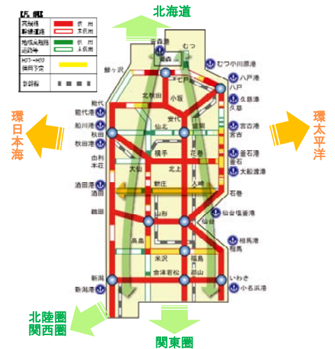
図7 日本海と太平洋の2面を活用した物流体系

19 東北ブロックは、日本海と太平洋の両方に面しており、 20 この地理的特性を活かし、東アジアや、北極海航路での 21 欧米諸国との連携強化・国際分業や新たなマーケットと 22 なる海外との直接的な交流、物流効率化の取組等による国際競争力の強化を推進していく 23 必要がある。