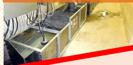
⑨ダムの底(浸透流観測室)