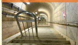
③監査廊を見下ろす