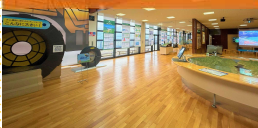
①インフォメーションセンター