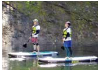
Stand Up Paddleboard