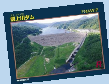
各ダムで配布しているカード型パンフレット「ダムカード」

普段は入ることのできないインフラ施設を公開して「非日常」を楽しめる機会として、近年注目されているダムツーリズム。摺上川ダムも取り組んでいます。地域にとって身近なインフラである摺上川ダムのご魅力をご紹介します。