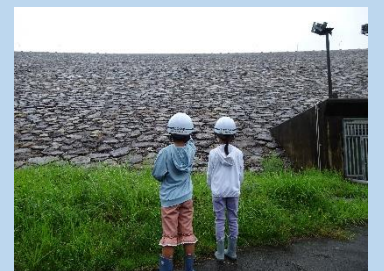
ダムツーリズムとしての特別な機会も...ご紹介！