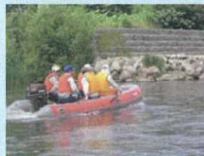
船による河岸の情報収集等