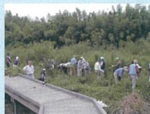
ピオトープの整備