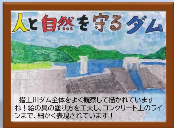
摺上川ダム全体をよく観察して描かれていますね！絵の具の塗り方を工夫し、コンクリート上のラインまで、細かく表現されています！