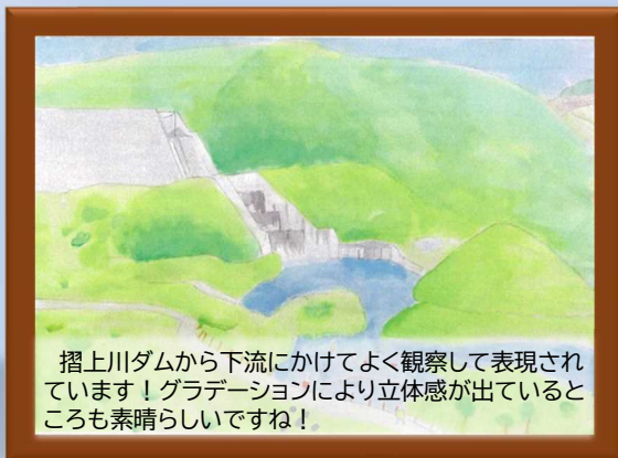
摺上川ダムから下流にかけてよく観察して表現されています！グラデーションにより立体感が出ているところも素晴らしいですね！