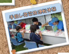
手回し発電機運転体験

カヤック体験は、 開始早々に予約が埋まって しまうほど大人気でした！ 初めての方でも安心して ご参加いただけます！