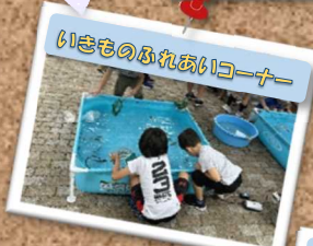
いきものふれあいコーナー