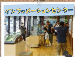
インフォメーションセンター