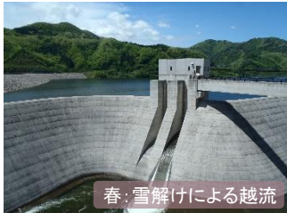
春: 雪解けによる越流