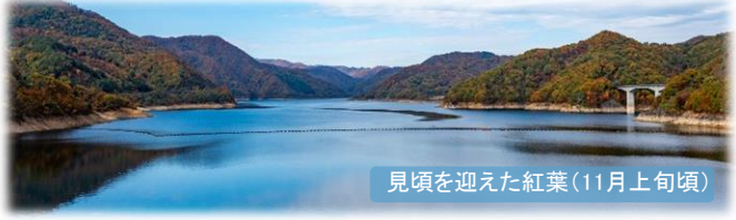
見頃を迎えた紅葉(11月上旬頃)