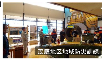
茂庭地区地域防災訓練

茂庭地区地域防災訓練が、摺上川ダムを会場に、「大規模洪水」を想定した内容で実施されました。避難所開設運営確認、ダム警報設備の音の届き方の確認等が行われました。