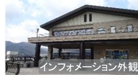
インフォメーション外観