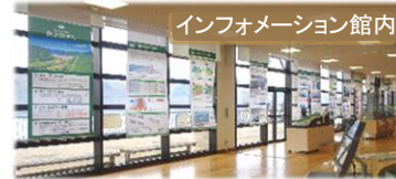
インフォメーション館内

美しい四季とロックフィルダムの構造美を魅せる「大型グラフィック」や、摺上川ダムのはたらきや、ダムと人々の暮らしとの関わりが分かる「パネルコーナー」などをリニューアル！より分かりやすくダムについて学んでいただけます。