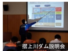
摺上川ダム説明会