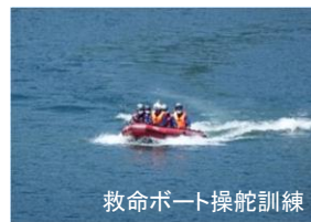
救命ボート操舵訓練

茂庭っ湖は水難事故救助のボート訓練にも利用されています。また、消防署の職員向け説明会を行い、洪水時の対応などお話ししました。今後も地域の防災のために、摺上川ダムについて知っていただく取り組みを行っていきます。