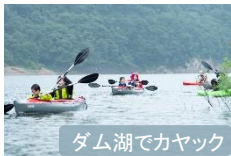
ダム湖でカヤック