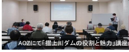
AOZにて「摺上川ダムの役割と魅力」講座