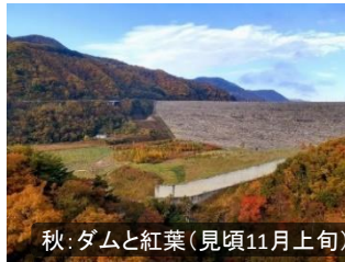
秋: ダムと紅葉(見頃11月上旬)