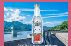
「ももりんウォーター Sparkling」

福島市の水道水をボトルングした「ふくしまの水」が、品質評価コンテストモンドセレクション2022において、2015年から8年連続で金賞以上を受賞しました。今回初出品した炭酸水「ももりんウォーター Sparkling」も金賞を初受賞しました。福島市水道局HPより引用