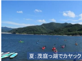
夏: 茂庭っ湖でカヤック