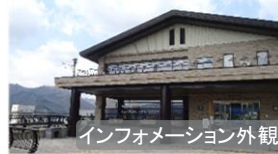
インフォメーション外観