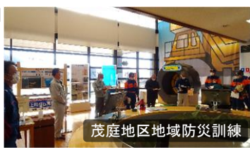
茂庭地区地域防災訓練

茂庭地区地域防災訓練が、摺上川ダムを会場に、「大規模洪水」を想定した内容で実施されました。避難所開設運営確認、ダム警報設備の音の届き方の確認等が行われました。