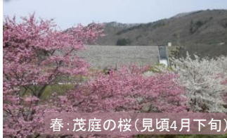
春：茂庭の桜(見頃4月下旬)