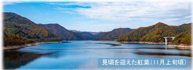
見頃を迎えた紅葉(11月上旬頃)