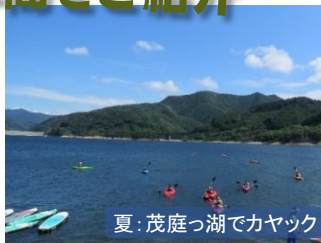
夏：茂庭っ湖でカヤック