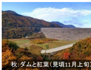
秋：ダムと紅葉(見頃11月上旬)