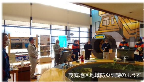
茂庭地区地域防災訓練の様子