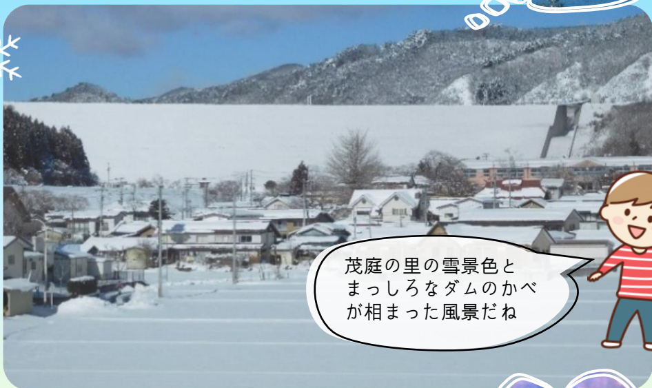
茂庭の里の雪景色と まっしろなダムのかべ が相まった風景だね