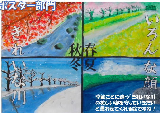
季節ごとに違う「きれいな川」の美しい姿を守っていききたいと思わせてくれる絵ですね！