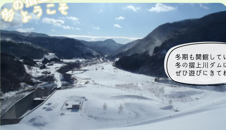
冬期も開館しています！ 冬の摺上川ダムに ぜひ遊びにきてね～！