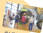
ダム建設に使われた46tダンプのタイヤ大きいな～!