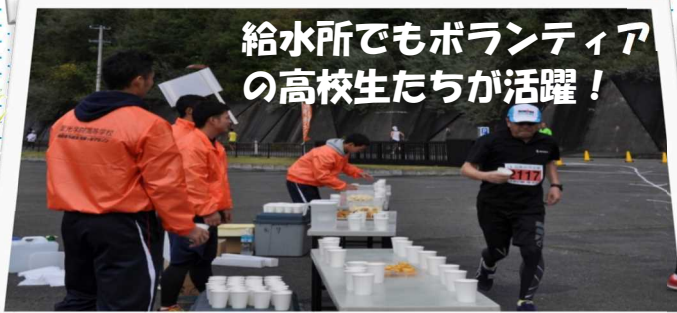
給水所でもボランティアの高校生たちが活躍！