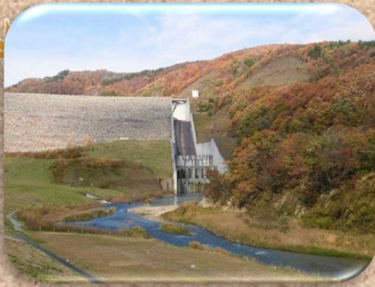
下流の新広瀬橋から撮影したダムと紅葉。

紅葉の見ごろは例年より遅かったものの、今年もキレイに色づいて、ダムへいらして下さった皆様の目を楽しませてくれました。今回はその写真と、管理所からのお知らせ、また10月27日に行われた「第12回 湯のまち飯坂・茂庭っ湖マラソン大会」の様子、今後の茂庭っ湖でのイベント情報等をお届けいたします!(^^)!