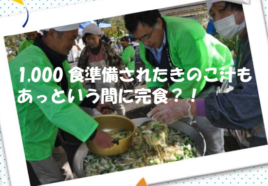
1,000食準備されたきのご汁もあっという間に完食？！