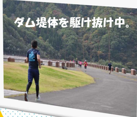
ダム堤体を駆け抜け中。