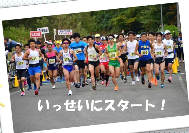
いっせいにスタート！

10月27日(日)のマラソン大会当日は少し小雨が降った時間帯もありましたが、ボランティアの方々にもご協力いただき、無事に開催されました。参加者は657名！今年は紅葉が例年より遅れましたので、残念ながら開催日はまだまだ緑でした(^)