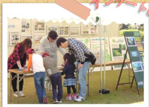
アンケートのご協力