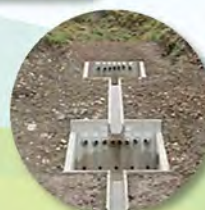
よこ ▲横ボーリング