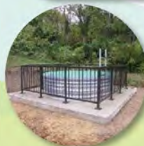
しゅうすいせい ▲集水井