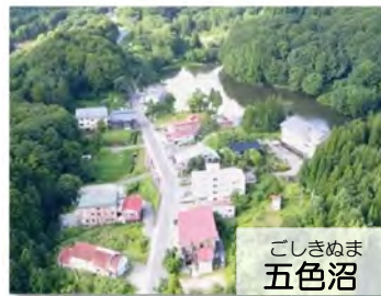
こしきぬま 五色沼

地すべりのあとに できたくぼ地に、 水がたまってでき たものと考えられ ています。