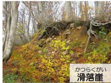
かつらくがい 滑落崖

地すべりによって つくられた崖で、 地面が動いたあと をはっきりと示し ています。