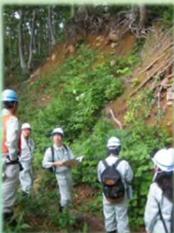
かつらくがい 滑落崖の見学