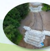
けいりゅうほぜんこう ▲溪流保全工