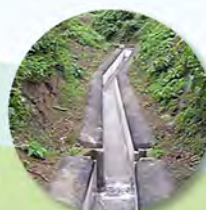
すいろこう ▲水路工