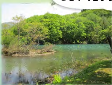
ごしきぬま 五色沼