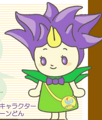
出張所キャラクター リンどん