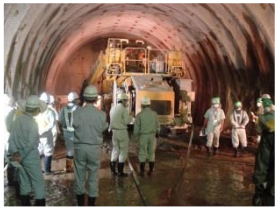
トンネル最奥部。 実際使用している機械を見ながら工事の説明。

平成27年6月16日～18日の3日間、トンネル貫通を目前に控えた“笹根トンネル工事現場”で研修会を行いました。酒田河川国道事務所と庄内総合支庁から若手技術者を含む延べ68名が参加し、施工中のトンネル切り羽(トンネル掘削部)状況や機械設備等を見ていただきましたが、皆さん真剣な表情で説明に耳を傾け、また多くの質問をいただいて、大変活気のある研修会となりました。