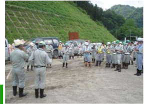
トンネルに入る前。 施工者と当出張所長からの注意と説明。