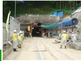
トンネル坑口前。 真っ暗な内部が見えます。