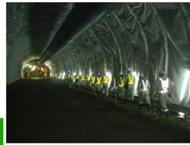
トンネル内。 反射ベストの明るさ大活躍です。