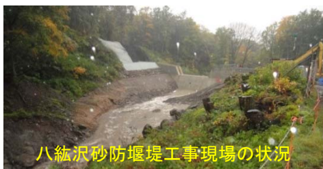
点検した施設とその点検結果（H26.10.15実施）