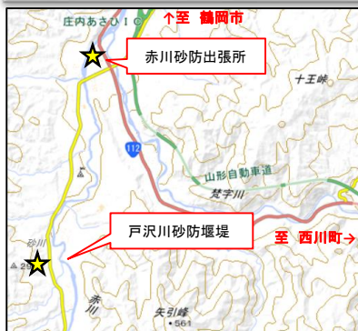
この地図は、国土地理院長の承認を得て、同院発行の電子地形図(タイル)を複製したものである。 【承認番号平30東複、第23号】