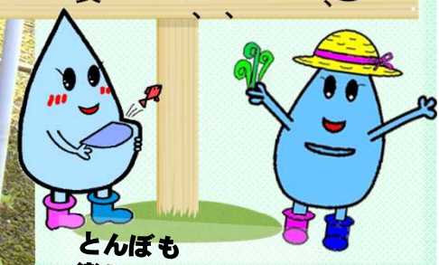
とんぼも楽しそう！

お知らせ 令和6年5月26日(日)に、大鳥(旧朝日村)の、タキタロウ館で「タキタロウまつり」が行われ、当出張所も共催しパネル展示や模型展示SABOカードの配布などを実施しました。26日はとても天気が良く、時折突風が吹くなど、約5000人という大勢の方々が集まっていました。