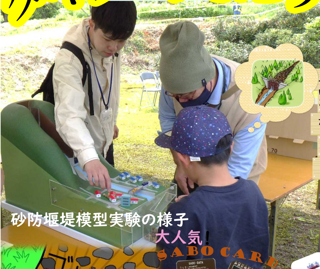
砂防堰堤模型実験の様子