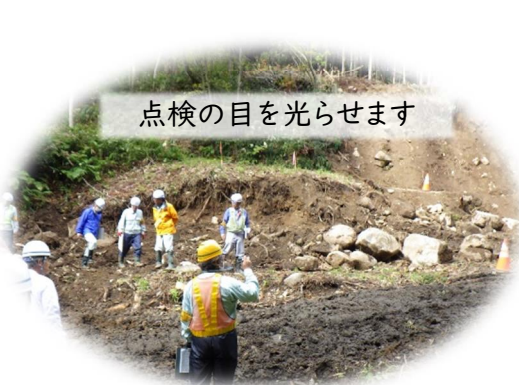
点検の目を光らせます

安全パトロールを通して良い点・改善点を共有し、今後も事故無く工事が完了出来るよう取り組んで参ります。