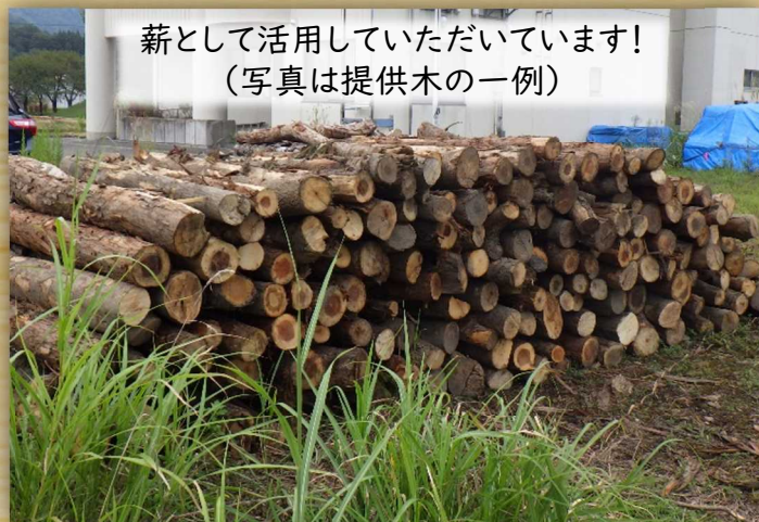
薪として活用していただいています! (写真は提供木の一例)