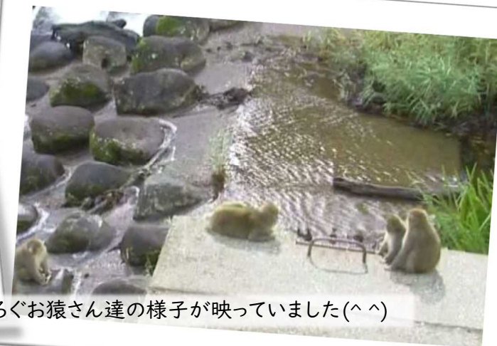
10月某日の朝8時頃、CCTVカメラにくつろぐお猿さん達の様子が映っていました(^^)

国土交通省 東北地方整備局 新庄河川事務所 赤川砂防出張所 〒 997-0404 山形県鶴岡市下名川字落合 2 2 7 TEL : 0235 ( 53 ) 2841 FAX : 0235 ( 53 ) 2807 ● HPアドレス http://www.thr.mlit.go.jp/shinjyou/ ● 公式X(旧Twitter) もぜひご覧ください。『新庄河川』で検索! ご覧いただいたご意見、ご感想をお寄せ下さい